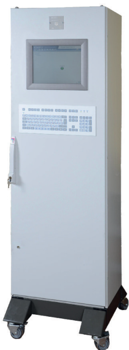
Рис. 4. Внешний вид КСПБ-01 АСМЯРОГ

АСМЯРОГ возможно применение КСПБ в нескольких исполнениях: