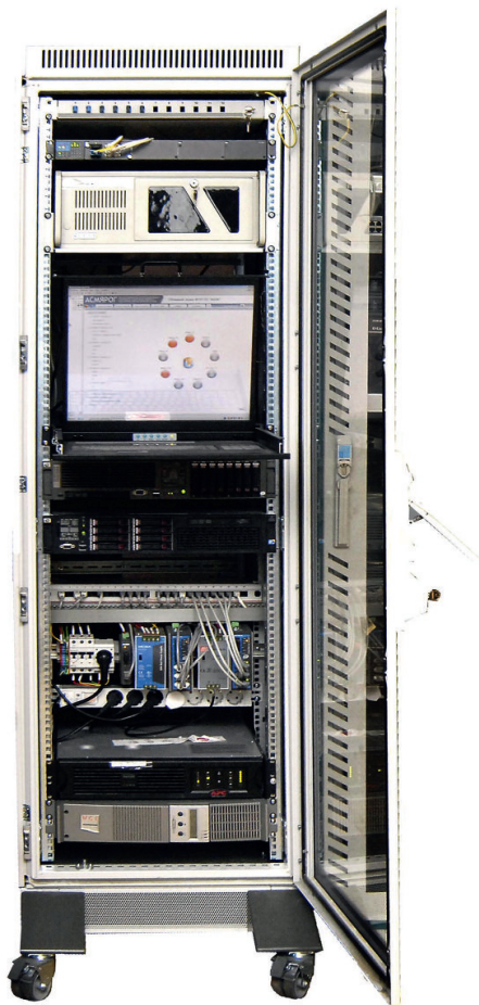
Рис. 2. Внешний вид ВУ ЦКМ АСМЯРОГ