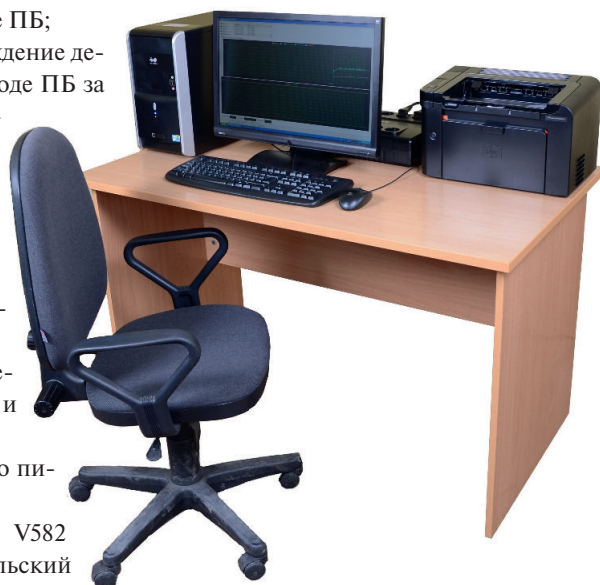
Рис. 3. Внешний вид АРМ ЦКМ и ЦКЗ АСМЯРОГ

В зависимости от степени распределённости системы на нижнем уровне